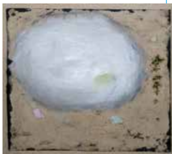
Witte Wolk | monoprint

Als het goed is vertellen wij samen een verhaal'