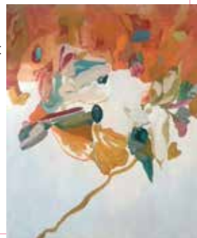
Dat ik bloesem | eitempera op doek