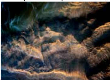
Dans | fotografie – Epson Satijn print

Geertrui van Herwijnen ( geertruivanherwijnen.nl ) "Wanneer je kijkt zie je nog niet wanneer je ziet grijpt het je aan" (Willem Hussem) 'En zo loop ik rond in de Bergense natuur: kijkend en plots ziend. Het zijn wow-momenten die ik vang met mijn camera. Een golvendans in een duinpoeltje, een drijvend vlies op een plas – het lijkt abstracte schilderkunst. De natuur, in zijn eindeloze veelheid aan vormen, is de bron van mijn fotografisch werk.'