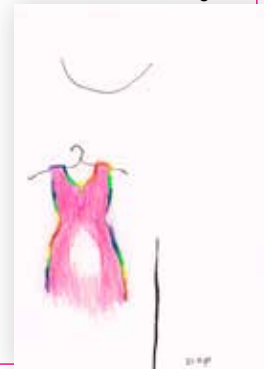
Jurk 1995 | inkt, potlood

en die te voorzien van betekenisvolle versiering in bovengenoemde kleuren. Deze tekening maakte ik kort nadat ik in de negende maand van de zwangerschap mijn dochttertje had verloren. De basis van Jurk 2024 is de jurk die ik droeg toen ik in 1997, opnieuw hoogzwanger, in het huwelijk trad.'