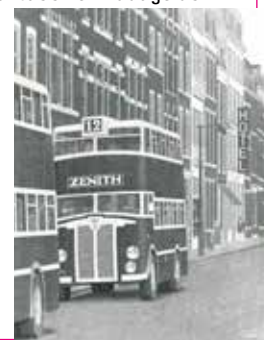
Zenith | ets

fiets pakken om buiten nog wat te tekenen. Het ritueel van inmiddels ruim een halve eeuw. Mijn ogen zijn nog goed en de artrose heeft nog niet toegeslagen. Ik mag mij gelukkig prijzen!'