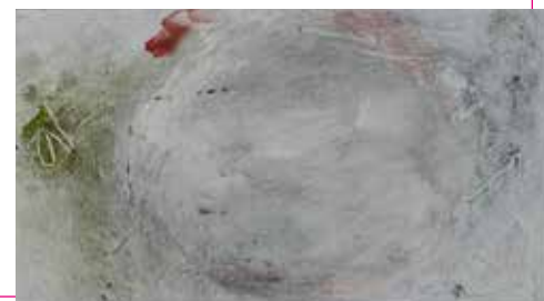
Turning Point | monoprint

'Ik werk in gemengde techniek en ets, meestal monoprints. Beeldend werken is voor mij een soort mediteren. Ik werk intuïtief, meestal begin ik blanco, zonder vooropgezet idee. Met een paar verf/inktplekken op papier of zinkplaat nodig ik het Toeval uit om met mij mee te spelen... als het goed is vertellen wij samen een verhaal...'