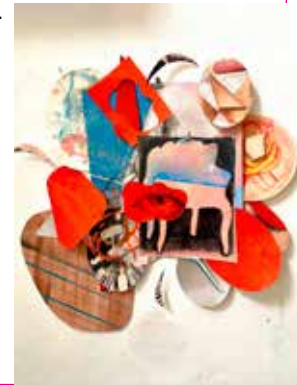
What am I | installatie

Op de wand van mijn atelier is dan ook goed te volgen waar ik mee bezig ben. Er hangen ruw uitgesneden stukken papier met tekeningen erop. Wat is een tekening en wanneer wordt het een sculptuur? En wanneer is het klaar om te laten zien? Deze installatie bestaat uit losse werken die samen een nieuw beeld vormen.'