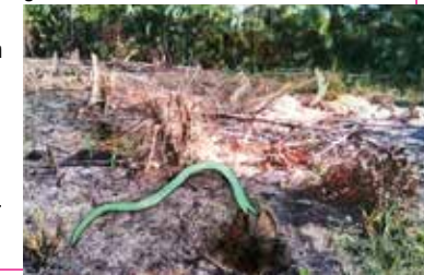
Kostgrond | acryl, houtskool, boombastfiber

'Het werk Kostgrond , geïnspireerd door de afgebrande velden in het oerwoud van Suriname, is een foto, digitaal op doek afgedrukt en bewerkt met acryl en houtskool. Hierop zijn groene papierkiempjes en uitsteeksel van bastdraden aangebracht. Gerelateerd hieraan is Bast met Schimmels , een papier-maché klei object. Immers zonder schimmels is er geen groei van planten. Naast de aardse verbeelding van schimmels is de keuze van dit medium ook gebaseerd op het letterlijke recyclen van versnipperde oude prenten. Dus zijn vorm en inhoud in dit geval identiek.'