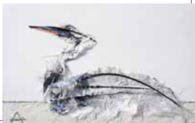
Fuut 2 | gem. techniek

'In deze tentoonstelling zijn een ouder werk en twee recente werken te zien. In 2010 startte ik met het thema vogels. Dit werk heeft een geschuurde aluminium ondergrond en is direct achter glas ingelijst. Later ben ik verdiepte lijsten gaan gebruiken. Omdat ik tot de conclusie kwam dat het beter is om de materialen ruimte te geven. Aangezien de charme van het werk juist bepaald wordt door een gelaagdheid, waarbij de materialen in meer of mindere mate loskomen van het platte vlak.'