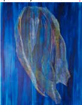
Remember I | waterverf, potlood op papier

Ik teken met kleurpotloden op verschillende soorten papier; de keuze van materiaal luistert bij mij nauw.'