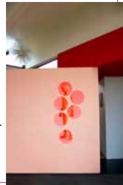
Duizend keer Dwalen III | print in acrylglas op alu-dibond