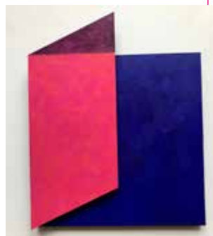
zonder titel | wandobject