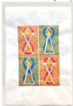
Flow | stempels op papier