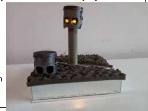
Zwischen Angst und Zuneigung | kinetisch object

Wat dit teweeg heeft gebracht in de samenleving zegt de titel van dit object: "Tussen angst en affectie".