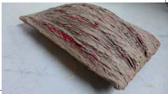
Bedding | textiel, klei

sporen hiervan blijven zichtbaar in het eindresultaat. Zowel dit werkproces als het eindresultaat voelen voor mij aan de ene kant natuurlijk maar aan de andere kant ook kunstmatig. Natuur versus cultuur. Het persoonlijke versus het neutrale. Zacht versus hard. Tegenstellingen die uitdagen en verleiden.'