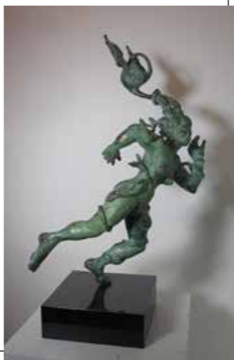
You can run but you can't hide | brons

die opduiken in mijn fantasie en die vragen om concreet te worden. Wat dan leidt tot weergave in acryl op doek en via de cire perdue methode tot beelden in brons.'