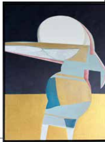
The way she moves | acryl op doek

Wat mij betreft zijn het alle drie gelukkigmakende bewegingen.'