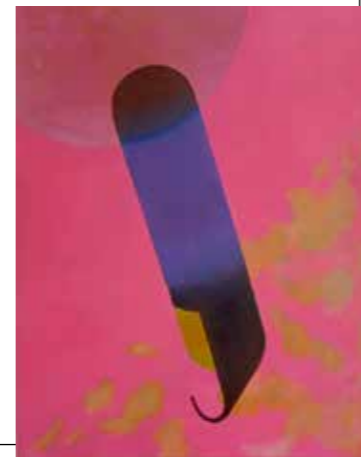
Tripelpunt | olie/acryl op doek