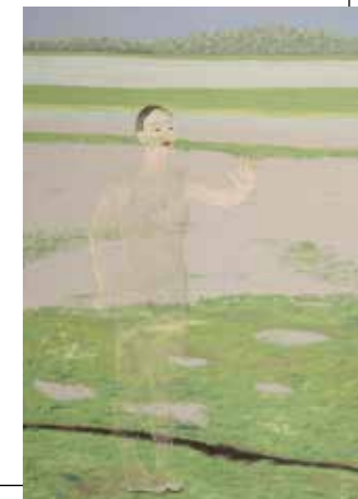
Texel | acryl op doek

kleine beweging die, als die door velen gevolgd wordt, grote gevolgen kan hebben.'