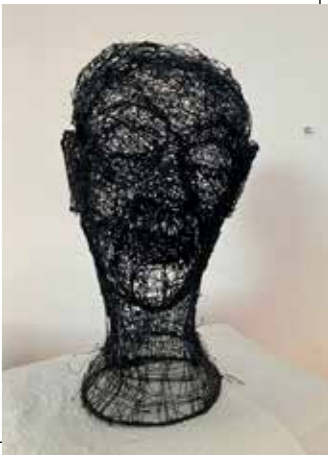
Op het tweede gezicht | 3D pen ABS

"The hollow mask effect" heet deze optische illusie.'