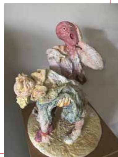
Piëta | terracotta

'De wereld is vol tegenstellingen. Bizarre paradoxen die merkwaardig genoeg vaak naast elkaar bestaansrecht blijken te hebben. Allerlei onmogelijke situaties – die al of niet tegelijkertijd plaatsvinden en die over en weer elkaars eigenaardigheden lijken te benadrukken – vormen het leidend motief in mijn werk. Via de cire perdue methode, een oeroude maar springlevende techniek, druk ik deze inspiratie uit middels in brons gegoten beelden. Recentelijk leg ik mij ook toe op het vormgeven van mijn verbazing en indrukken in terracotta.'