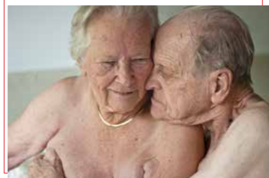
De liefde is alles, hè | fotoprint op dibond

'Je hebt gevoel voor gevoel' zei een leraar tegen mij op de HKU. Iets wat nog steeds van toepassing is op mijzelf en op mijn werk. Mijn projecten gaan over intimiteit, liefde, de kracht van kwetsbaarheid en verbinding. Uitgewerkt in fotografie, film en poëzie. Kleine verhalen die tegelijkertijd universeel zijn. Mijn werk helpt mij om met een open blik en vol van verwondering naar de wereld te kunnen blijven kijken.'