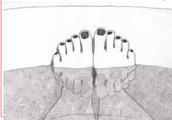
Bladvoeten | pen/potlood op papier

Ik teken graag met kroontjespen. Een lijn moet in één keer goed, trefzeker. En als het fout gaat: een oplossing bedenken of opnieuw beginnen. Tijd en aandacht worden zichtbaar.'