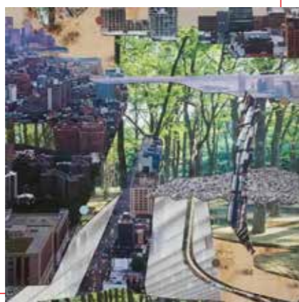
Narrative Landscape I | collage

'De Urban Landscapes collages hebben als onderwerp verstedelijking en herdefiniëring van landschap en natuur. Deze elementen, die in eerste instantie tegengesteld lijken, zijn meer en meer met elkaar verbonden. De natuur wordt gecultiveerd en aangepast naar de wensen van de maatschappij en steden groeien in hoog tempo. Daardoor verdwijnen oude waarden en ontstaat er een nieuw, soms vervreemdend, beeld. Gebieden en ruimtes waarin wonen, werken, verblijven en natuur samen komen. Stad én land als sociale ruimte en als cultuurlandschap.'