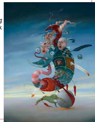
De Verwondering | olie op doek

'Mijn technieken zijn onbegrensd en hebben vooral tot doel duidelijk te maken wat ik de toeschouwer wil laten zien. De techniek moet heel dicht bij het onderwerp staan. Dat kan zowel olieverf zijn (het meest gebruikt), als ook acryl en andere verfsoorten. Mijn inspiraties komen voort uit de simpele dingen die dagelijks om mij heen gebeuren. Maar ook wel nachtdromen, die zich opdringen. Het is altijd mijn intentie om de beladenheid van bijvoorbeeld een schilderij te relativeren met humor.'