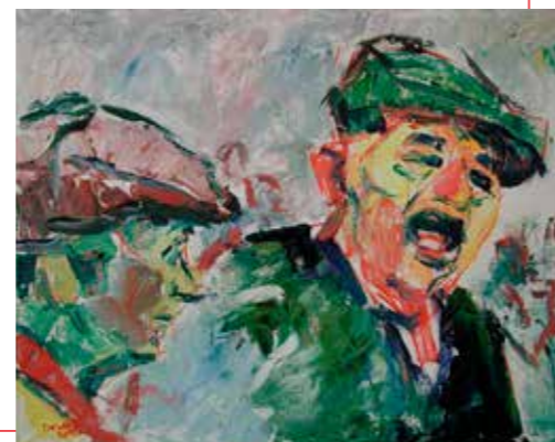
Franse Boertjes | olie op doek

Maar ik maak ook wel eens een zijsprongetje, bijgaand, en soms in opdracht...'