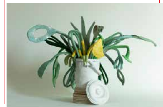
Flora Dementia | keramiek

Ik maak stillevens van alledaagse dingen. Ik ben geïnteresseerd in hoe alledaagse dingen gebruikt worden. Spullen bieden mij houvast. Gebruiksgoed vormt voor mij een aanleiding om actief op zoek te gaan naar hun biografie – bijvoorbeeld zichtbaar in slijtage – en die te visualiseren. Tot nu toe in klei, in films, en op papier.'