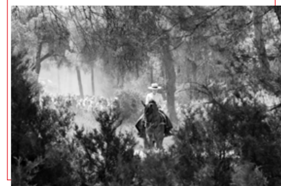
Tiempo Detente | fotografie

Ik heb een voorkeur voor documentaire- en straatfotografie.'