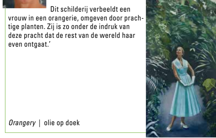
Orangerij | olie op doek