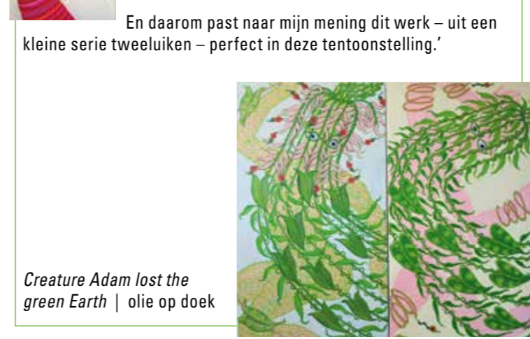
Creature Adam lost the green Earth | olie op doek