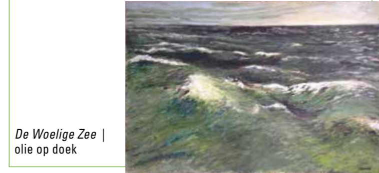
De Woelige Zee | olie op doek