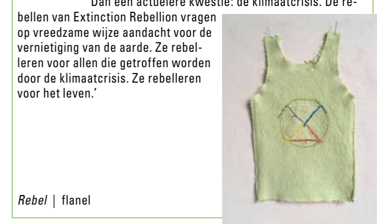
Rebel | flanel