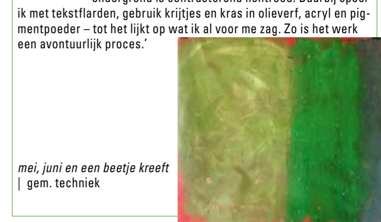
mei, juni en een beetje kreeft | gem. techniek

Liesbet Tol ( liesbettol.nl ) 'Ik heb altijd sterke kleurassociaties met woorden, namen en begrippen. Daarom heb ik er voor gekozen om de maanden mei en juni te schilderen in twee schakeringen groen. Mei met ronde vormen, juni meer als gras. Eind juni staat in het astrologische teken Kreeft en dat moet wateriger en blauwer. De ondergrond is contrasterend lichtrood. Daarbij speel ik met tekstfarden, gebruik krijtjes en kras in olieverf, acryl en pigmentpoeder – tot het lijkt op wat ik al voor me zag. Zo is het werk een avontuurlijk proces.'