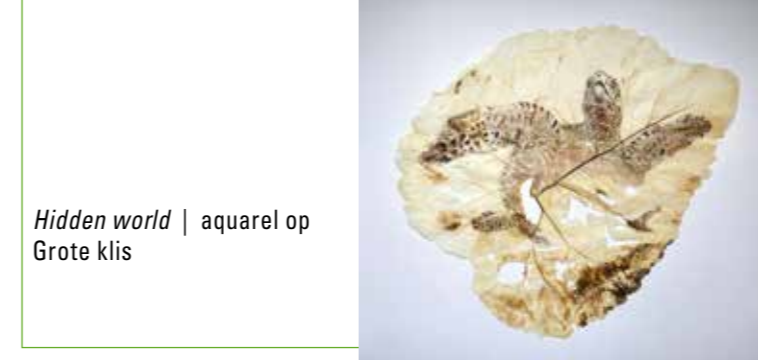
Hidden world | aquarel op Grote klis

Gígja Reynisdóttir ( gigareynisdottir.com ) 'In mijn werk verweef ik mijn twee grootste inspiratiebronnen: de natuur en de condition humaine. Kenmerkend is de centrale rol van de mens in vorm en gedrag. Door toepassing van natuurlijke vormen en/of materialen weerspiegelen actuele maatschappelijke thema's die mij op dat moment bezighouden. Thema's zoals intermenselijke relaties, vergankelijkheid, sociale cohesie en natuurbehoud zijn een terugkerende factor.'