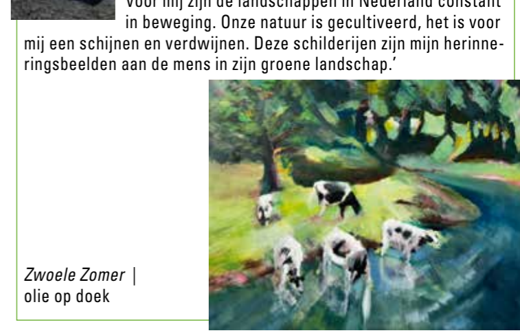
Zwoele Zomer | olie op doek