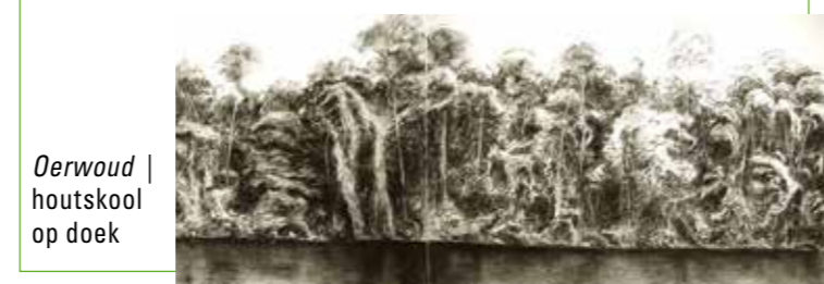
Oerwoud | houtskool op doek

ten doel gesteld deze elementen te verbeelden met het meest basale tekenmateriaal: houtskool – ruw en broos. Het is dan ook het favoriete uitdrukingsmiddel in mijn vele media omvattende werk.'