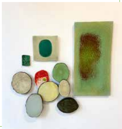
Roodharig meisje in het groen | porselein, geglazuurde klei

gebeuren als bron voor een keramische installatie (met een figuratief element) gebruikt. Meestal werk ik met abstracte begrippen als concentratie, verbinding, eenvoud en essentie. Maar wel met de mens als inspiratiebron.'