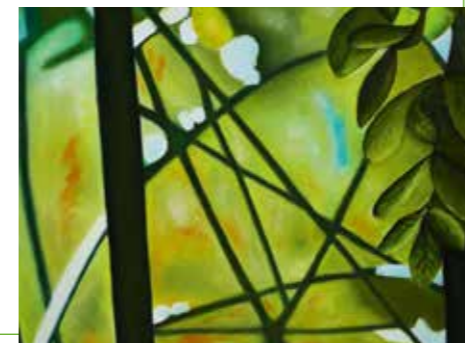
Sunday Morning Light II | pastel

De kleur van de natuur voelt vertrouwd, veilig en aangenaam. Groen zit vaak in mijn werk, ik kan er veel mee uitdrukken. De werken die hier getoond worden, zijn onderdeel van het project The Golden Light , ontstaan in Varanasi, India. In dat ontstaan speelde de relatie tussen licht en religie – en ook groen – een belangrijke rol.'