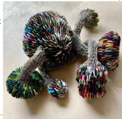
Woekerwarrel | wandobject

Mijn woekerwarrel : een "plant" met uitlopers, gemaakt van platte wijsdoppen en openingen van blikjes.'