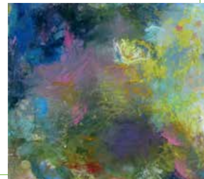
Waterlelie | olieverf en ei-tempera

Techniek: verschillende kleurpigmenten over elkaar, schijnbaar willekeurig maar toch doordacht, zodat er een juiste compositie ontstond. Een zelfstandig ontwikkelde ei-tempera techniek leverde transparantie op – wat het werk juist intensief maakte.