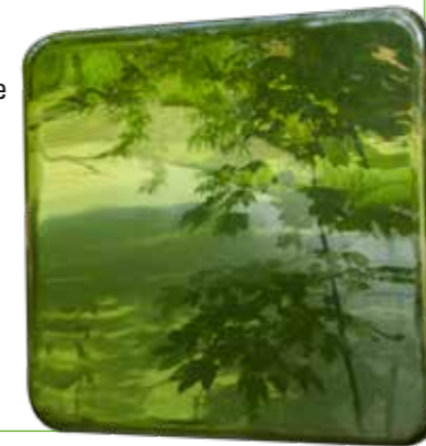
Window – Groen | foto op dibond

Mijn werk gaat vaak over landschappelijke en natuur- thema's. 'Groen' staat mij op het lijf geschreven: mijn naam is 'Groen', ik ben geboren in een 'groen' dorp, waar wij 'de Groentjes' werden genoemd.'