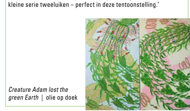
Creature Adam lost the green Earth | olie op doek

Saskia Spitz ( saskiaspitz.nl ) ' Creature Adam lost the green Earth no. 1 is onderdeel van een klein groen project. Bezorgdheid over de aarde, licht humoristisch. Uitgevoerd door de eerste mens Adam op het doek te plaatsen – verstrikt in het oerwoud, toen dat er nog was. En daarom past naar mijn mening dit werk – uit een kleine serie tweeluiken – perfect in deze tentoonstelling.'