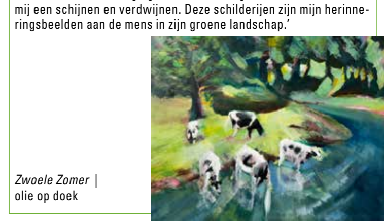
Zwoele Zomer | olie op doek