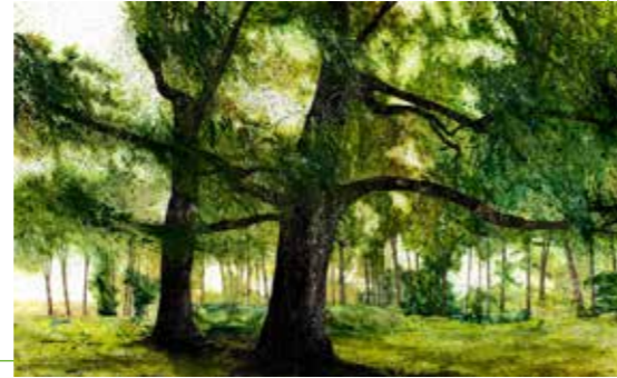
Bomen spreken | aquarel

Het gebruik van groen is voor mij een eerbetoon aan de natuur.'