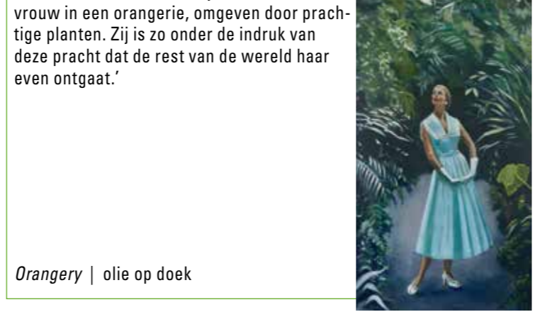
Orangery | olie op doek