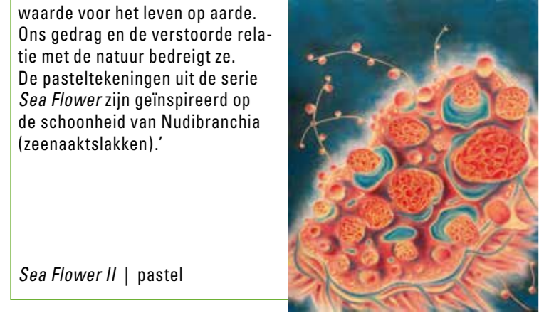
Sea Flower II | pastel