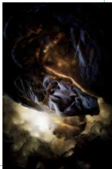
Frontier IV | foto

Belangrijke thema's die zijn werk inspireren zijn de menselijke evolutie die in toenemende mate door de mens zelf gestuurd wordt: ontwikkelingen in de genetica en onze relatie met technologie en de digitale wereld om ons heen.