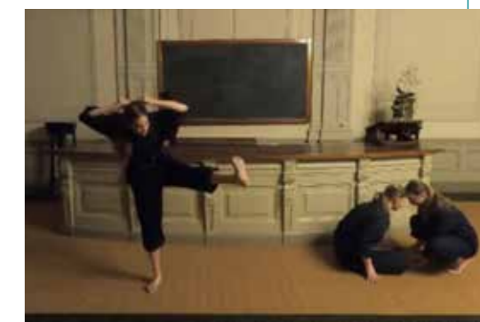
titel E | opname in Teylersmuseum Haarlem

'In mijn moderne choreografieën keert het thema klimaatverandering en de relatie tussen mens en milieu terug. Net als een spanning die zich opbouwt en die een nieuwe intensiteit met zich meebrengt. Subtiële dreiging groeit uit tot het onontkoombare. Abstractie meng ik graag met symbolisch verhaal en de thema's dringen zich op. Wat mij keer op keer blijft inspireren is het menselijk handelen. Welke keuzes maken wij als enig ras met deze vorm van bewustzijn en hoever reikt ons vermogen om te veranderen?'