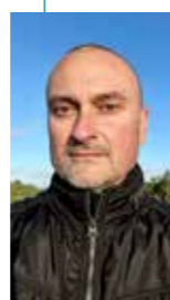
Brett Meredith ( brettmeredith.photography )

De surreële, vaak paradoxale beelden van de in Zuid Afrika geboren Brett zijn een existentiële zoektocht naar wat het betekent en hoe het voelt om mens te zijn. Ze overspannen ruimte, tijd en cultuur.