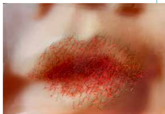
zonder titel | fotografie

In mijn werk is het leven bevroren en stilgezet op een vervreemdende manier. We weten niet meteen wat we zien. Ik maak ongemakkelijke en soms ongerijmde kunst. Mijn wereld is er één van contrasten en tegenstrijdigheden. De kunstmatige mooiheid, en de schoonheid van het lelijke: ik probeer het tot één beeld samen te brengen.'