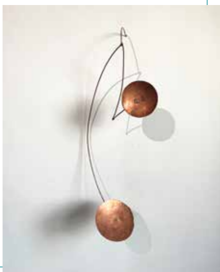
Riff VI | koper-plaat en draad

En ja, altijd is het materiaal mijn startpunt. Ik werk met karton, pure pigmenten en de laatste jaren ook met koper. Koper is een geduldig materiaal: verhitten, afkoelen, bewerken – het is als in- en uitademen.'