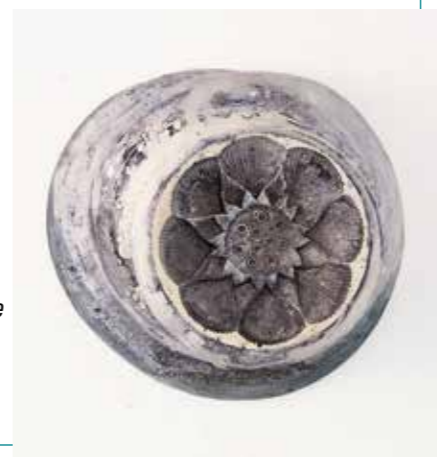
Japanese Impact | gips-cement

De laatste tijd maak ik ook tekeningen en ervaar min of meer hetzelfde werkproces – maar ontdek wel dat het platte vlak meer naar het verhalende leidt.'