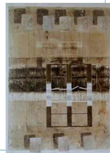
Waterstanden | ets

Ik maak etsen, lino's, houtdrukken, sjabloon-drukken, materiaaldrukken en tekeningen. De werken druk ik vaak af op courantpapier en bevestig het vervolgens op katoen. In de loop der tijd vergeelt het papier onder invloed van uv-licht – een proces dat het verstrijken van de tijd symboliseert.'