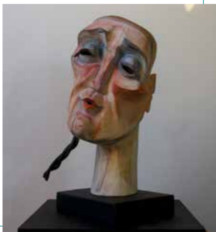
Rosh Pina | hout, pigment, staal

Gezichten fascineren me. Ik heb 't gevoel dat ik de persoon die in dat gezicht woont, herken...'