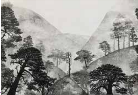
Scotland | monoprint

'Voor mijn lino's haal ik vaak ideeën uit het landschap waar ik ben. Het zijn als het ware ontmoetingen met het gebied. Thuis in mijn atelier kan ik alles waardoor ik getroffen ben vastleggen en daardoor vasthouden. Deze werken gaan over Schotland en de Azoren.'