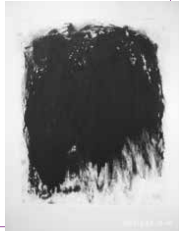
back to black... | monoprint

Als het goed is, vertellen we samen een verhaal...'