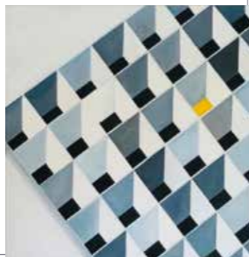
Yellow being there | olie op doek