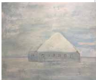
Boerderij Groeneweg Bergen | olie, acryl op doek