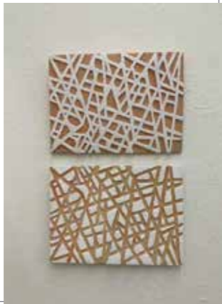
Tweedelig | beton positief + negatief