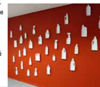
Inhoud | papier maché

Liesbeth van Woerden ( liesbethvanwoerden.nl ) ‘In bijna al mijn werken speelt contrast een rol; contrasten in materialen, contrasten tussen micro- en macroniveau, contrasten in betekenis binnen het kunstwerk en de werkelijkheid waarnaar het verwijst. Het werk Inhoud speelt met het contrast tussen kwetsbaarheid (papier) en onverwoestbaarheid (plastic). Daarnaast wordt de tegenstelling tussen inhoud en leegte in het werk onderzocht. Kunststof flacons van allesreiniger, afwasmiddel, terpentine, vloeibare zeep, wasbenzine, motorolie hebben slechts een afdruk in papier maché achtergelaten...’