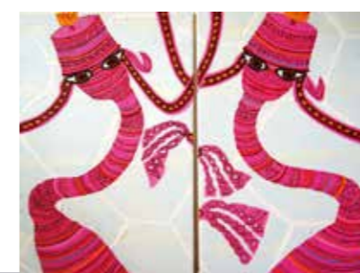
Waiting for the next Epoque | olie op doek

Saskia Spitz ( saskiaspitz.nl ) Saskia: ‘De titel zegt het al: wachten op betere tijden. Dit werk is een en al contrast door de hangende / wachtende figuren, waar weer lijnen overheen lopen. Dit tegen een achtergrond van o.a. oranje Power Flower bloemen. En als finishing touch nog verwijzing naar de natuur, contrast fel groene en hard blauwe bladeren. En dan probeer ik ook nog een eenheid te creëren...’