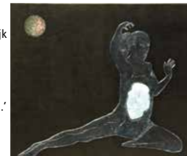
zonder titel | acryl op doek

Ubaldo Sichi ( ubaldo-sichi.nl ) ‘Het wonderlijke van contrasten is dat je zou verwachten dat ze door het grote verschil zouden botsen, maar nee, ze houden elkaar vaak in evenwicht. Een broos evenwicht, dat wel. In dit schilderij is er een contrast tussen donker en licht, maar ook tussen dans en stilstaande gedachten die soms in je buik huizen. Materiaalgebruik is een belangrijk expressiemiddel in mijn werk: eerder gemaakte transparante reliëfs door acrylmedium gieten in een wassen mal – en dan op verschillende wijzen combineren.’