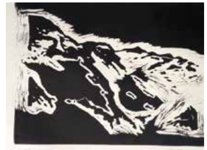
Duinwandeling | lino 31x40

Dit jaar liep dat allemaal anders en daarom besloten we – om de liefhebbers niet langer te laten wachten – om die dit jaar te bezorgen. Wat inmiddels gebeurd is.