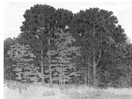
Duinlandschap met dennen (ets)