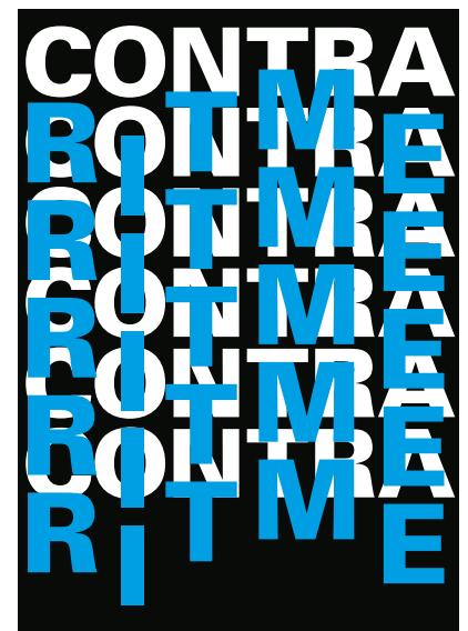
Expositie 27 mei t/m 20 augustus2017