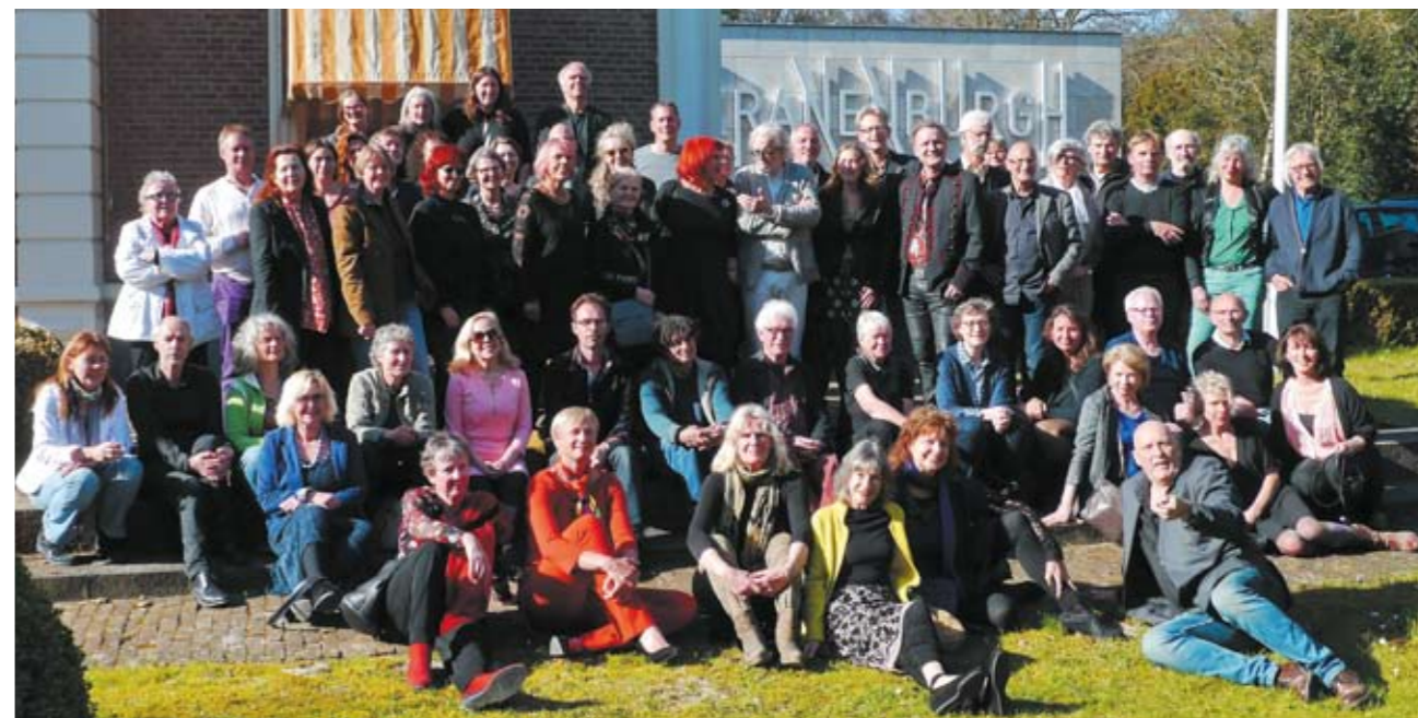
Een groot deel van de deelnemende kunstenaars aan de manifestatie KUNST = EEN VEELKOPPIGE DRAAK