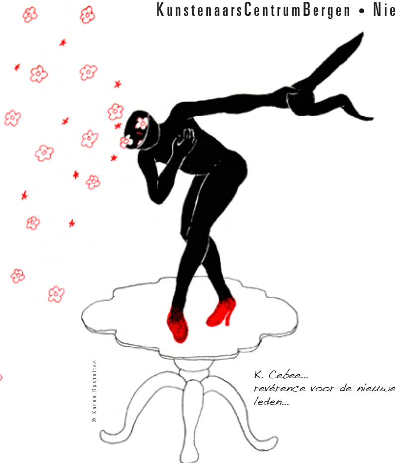
K. Cebee... révérence voor de nieuwe leden...

De tentoonstelling, die loopt van 1 februari t/m 15 maart 2015, is te zien in de expositieruimte van het KCB op de eerste verdieping van Kranenburgh.