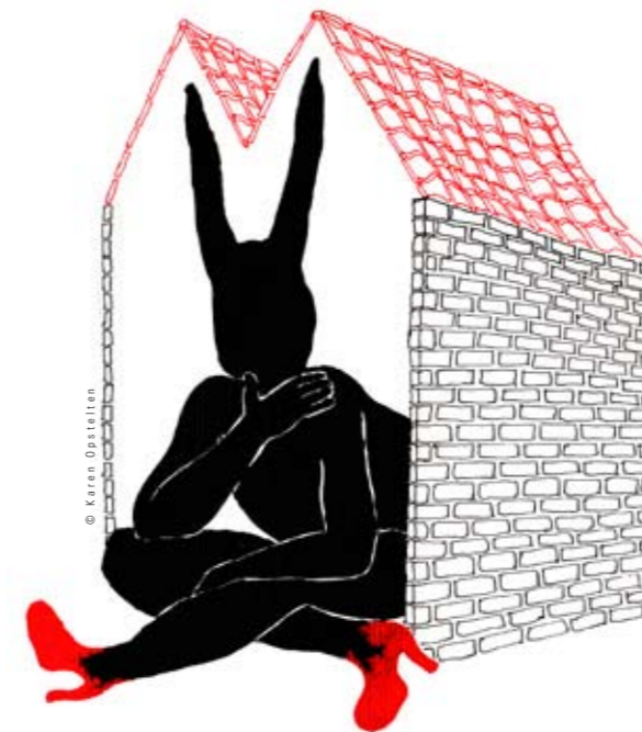
K. Cebee: "...Huisje KCBeesje..."